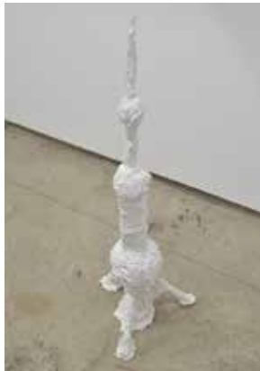
鹿庭健司 《The memorable place in my early days》