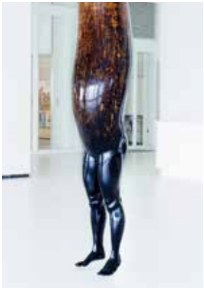
青木千絵 《BODY08-2 -昇華-》 2014 静岡市美術館