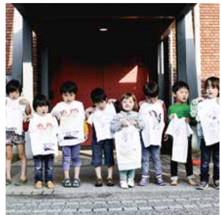
完成したTシャツはすぐに持って帰れます。